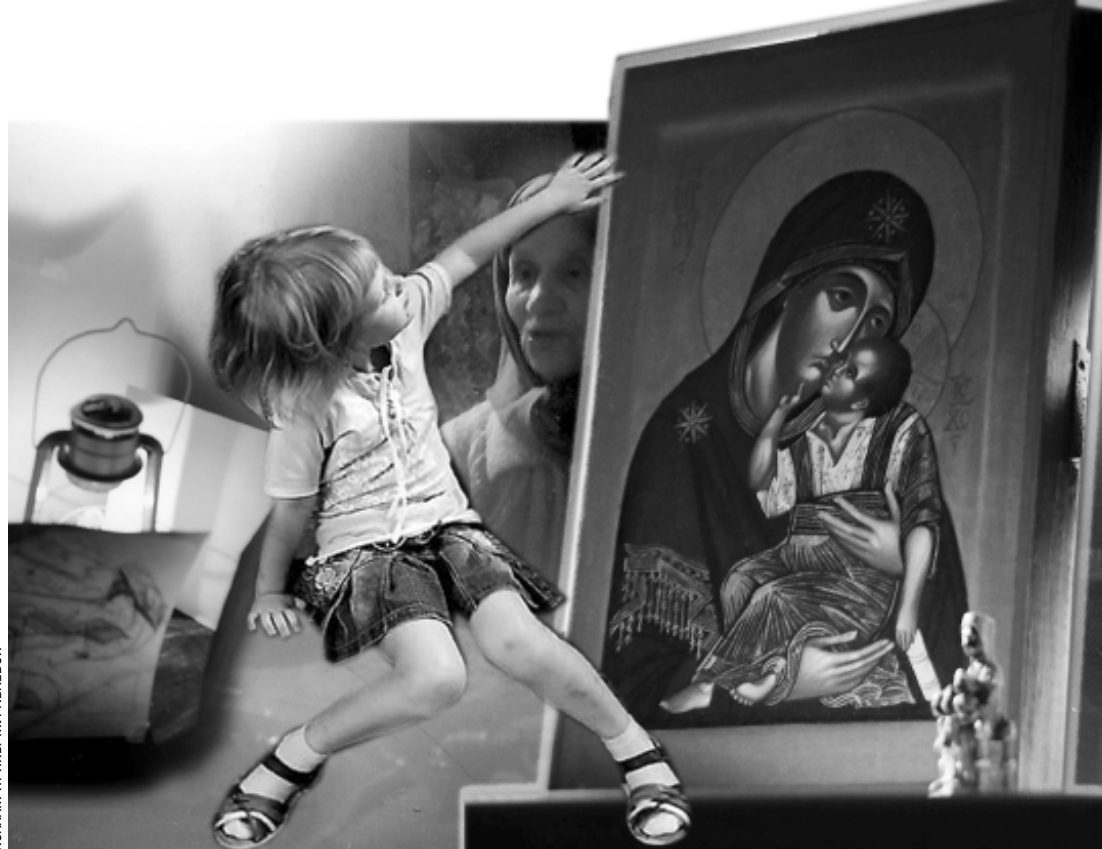
КОЛЛАЖ ИРИНЫ ЖУРАВЛЕВОЙ

МАЛОМОЩНЫЙ дизель-генератор был слаб даже для освещения небольшого поселка, поэтому свет от лампочки, висевшей в центре потолка маленькой избы, был тусклым и очерчивал грубые и глубокие тени на побеленных стенах.