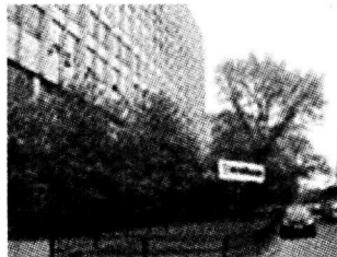
Здание офисно-производственного комплекса Kraftway

Какой бы сложной ни была ваша проблема, с этим можно что-то сделать! Купите, изучите и примените книгу Л. Р. Хаббарда