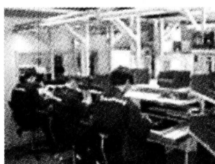
Линия подготовки комплектов