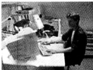
Инженер тестовой лаборатории

Компьютеры Kraftway в Магнитогорске: магазин «Герма», ул. Комсомольская, 20. Тел. (3519) 23-89-77.