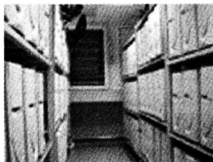
Стеллажи в термокамере