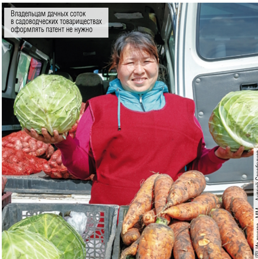
Владельцам дачных соток в садоводческих товариществах оформлять патент не нужно

Поправки в Налоговый кодекс, которые в конце января приняла Госдума, вызвали бурную реакцию у владельцев личных подсобных хозяйств