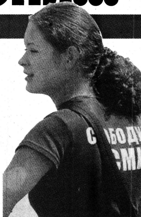
Маша Гайдар – за свободу слова.