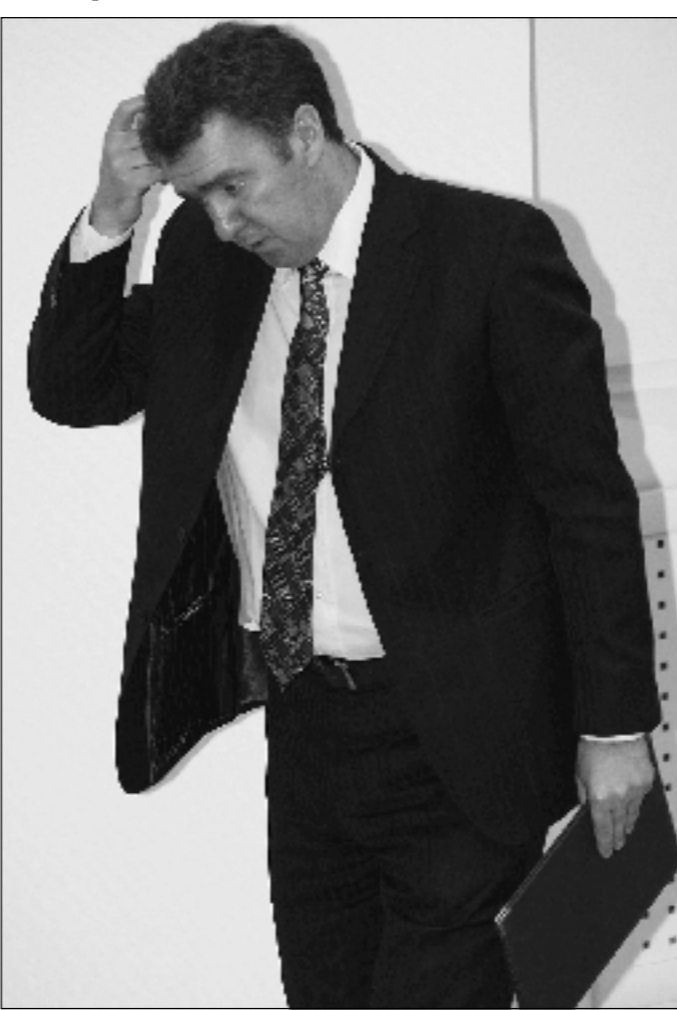
Управлять процессами – нелегкий труд