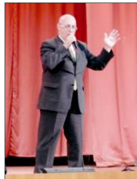
НА СНИМКЕ > Свой вариант гимна – слова и музыку представил заслуженный артист России Иракий Гвенцадзе

В ЭТОТ ДЕНЬ в большом актовом зале МГТУ царила атмосфера торжественности и взволнованности. Еще бы: состоялось открытое прослушивание гимнов университета, представленных на конкурс по случаю предстоящего 75-летия вуза.