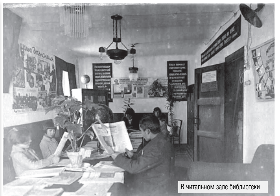
В читальном зале библиотеки