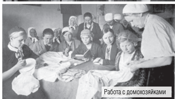
Работа с домохозяйками