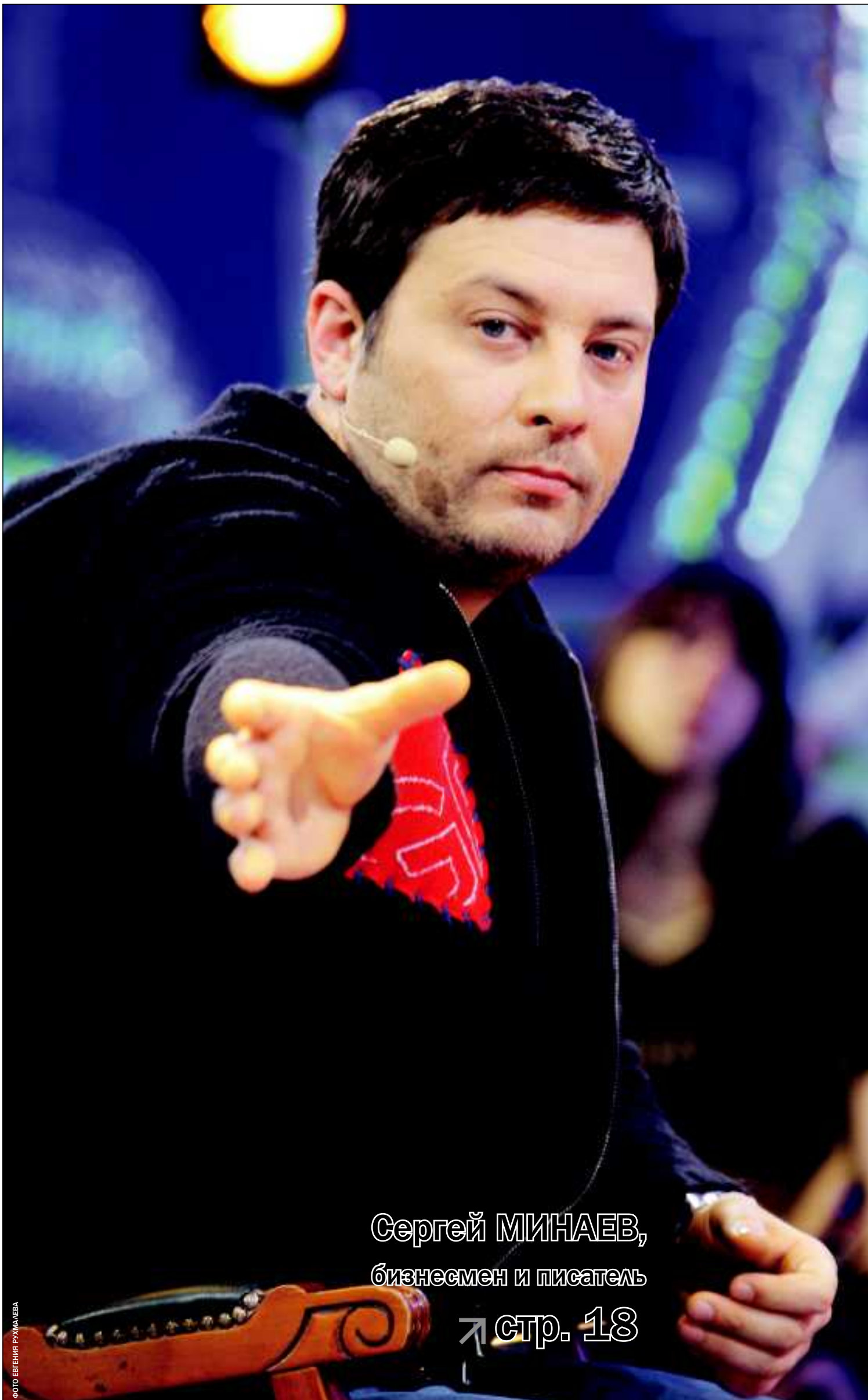
Сергей МИНАЕВ, бизнесмен и писатель