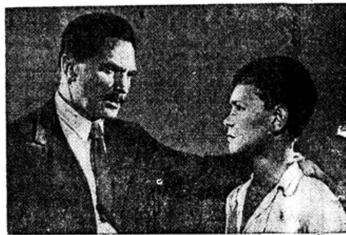
Новый кинофильм Московской студии «Союздетфильм» — «Личное дело».