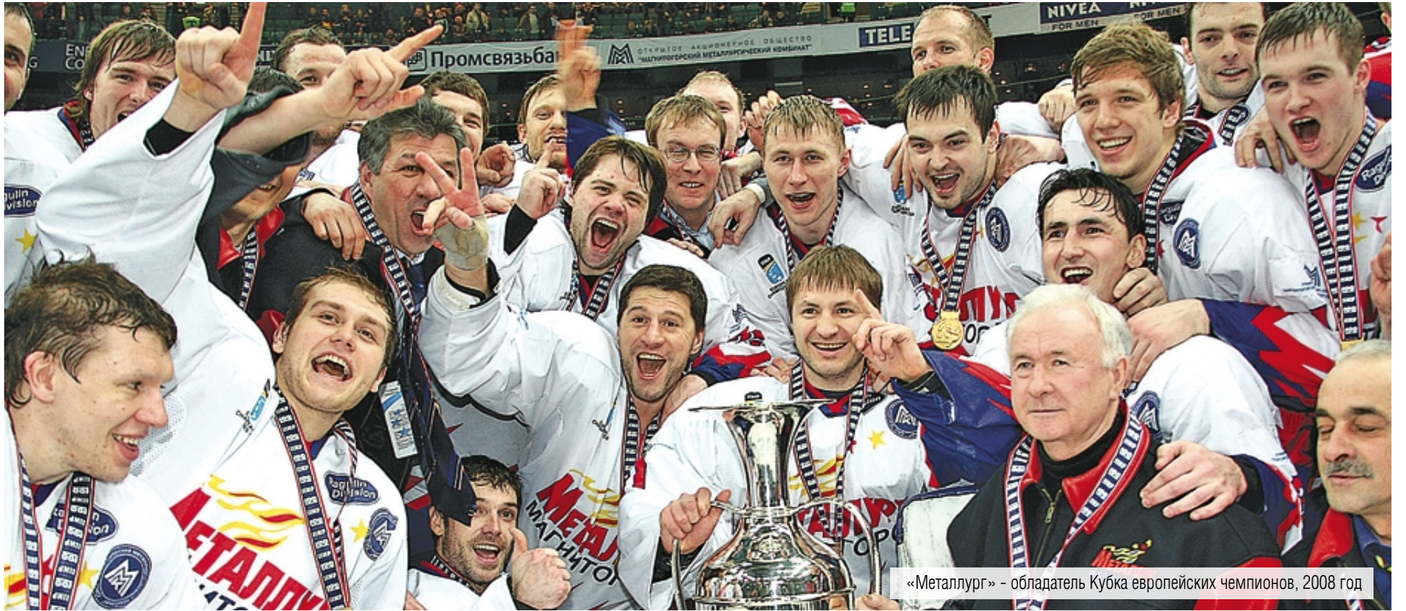
«Металлург» – обладатель Кубка европейских чемпионов, 2008 год