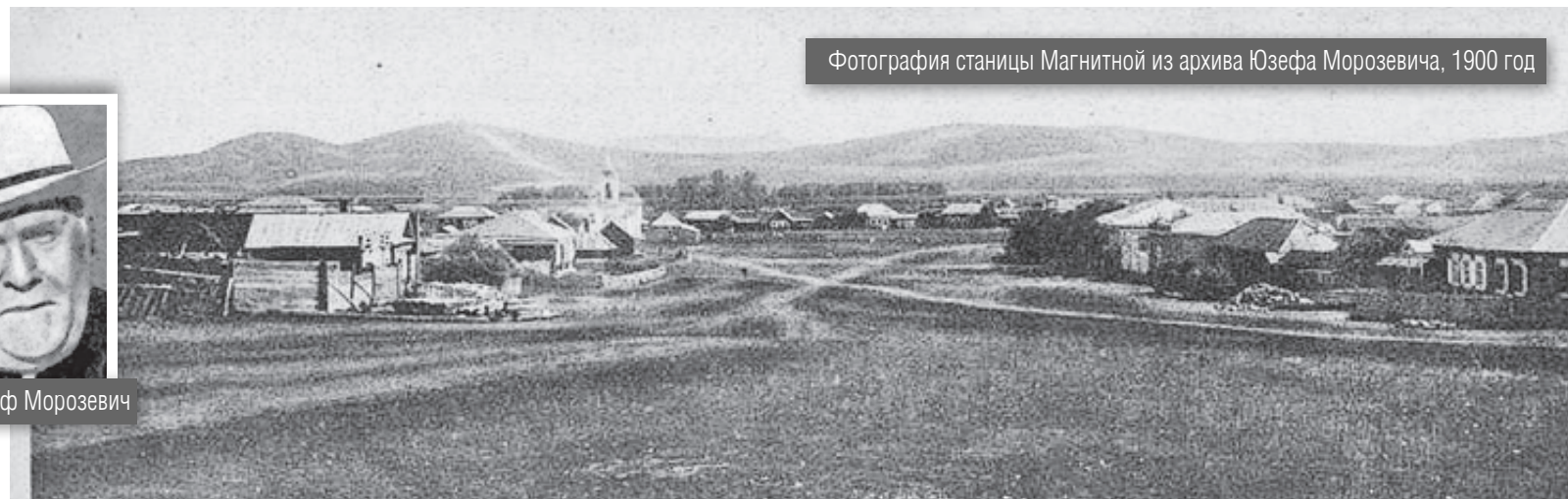
Фотография станции Магнитной из архива Юзефа Морозевича, 1900 год