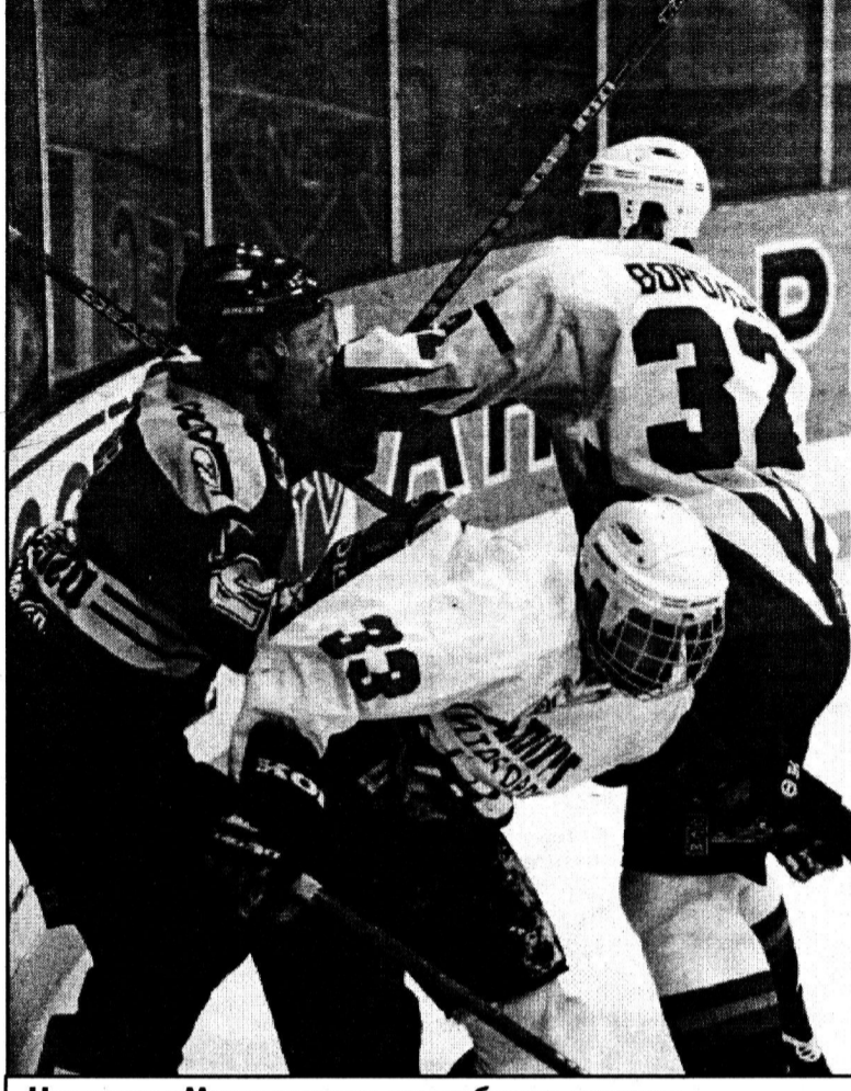
Новички «Металлурга» не робкого десятка.

Конечно, по уровню мастерства нынешний «Металлург» явно уступает прошлогоднему. Нет той солидности в игре, нет смущавшей соперников уверенности в своем превосходстве, нет, наконец, наличия в составе четырех если не равноценных, то по крайней мере примерно равных по силе пятерок. Но есть нечто другое, что значительно компенсирует численное выше. Во-первых, команда полностью управляема — тренером, не раз доказавшим свою «профпригодность» к работе на высшем уровне, куда легче (да и интереснее) работать с новым составом. А во-вторых, ряд новичков, пополнивших «Металлург» в межсезонье, ничуть не уступают в мастерстве покинувшему клуб чемпиону, но при этом стремлится их в боеспособности и стремлении к