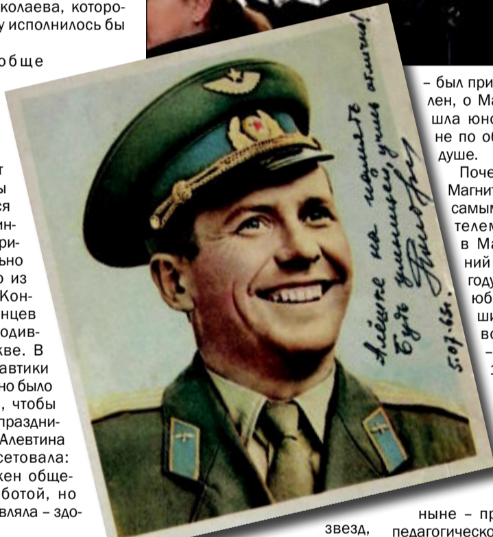
звезда, дважды Герой Советского Союза, звездной болезни не подцепил

– был приветлив и общителен, о Магнитке, где прошла юность, вспоминал не по обязанности, а по душе.