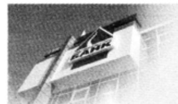
Генеральная лицензия ЦБ РФ № 1522

Мощь, развитие, успех — основные характеристики работы Уралвнешторгбанка. Итоги 2005 года — весомое тому подтверждение: 2-кратное увеличение валюты баланса и кредитного портфеля, 4-кратный рост прибыли, на 80% увеличен собственный капитал банка.