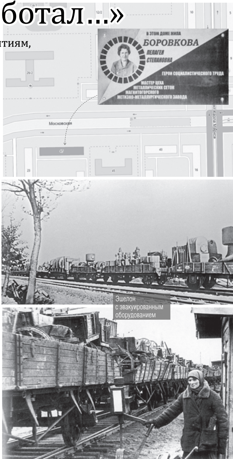
Эшелон с эвакуированным оборудованием