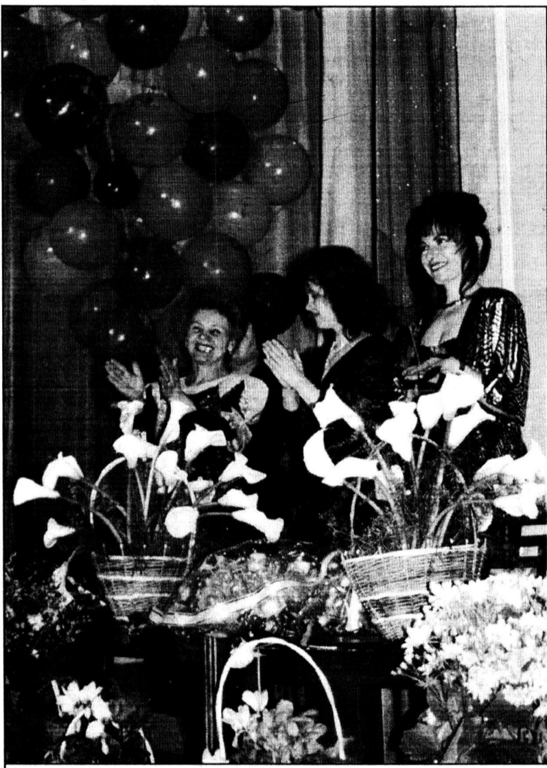
«Ровесник» — это всегда праздник!