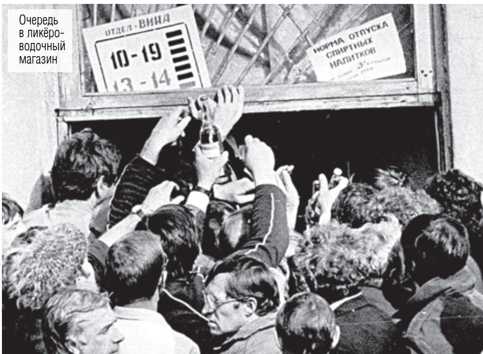
Очередь в ликероводочный магазин