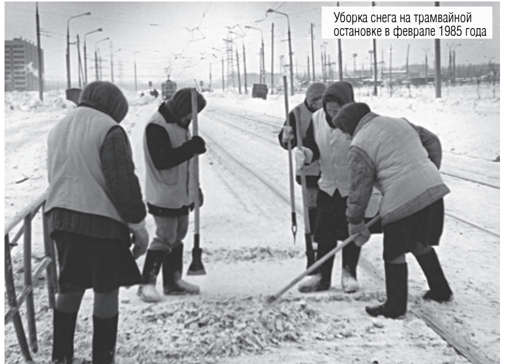
Уборка снега на трамвайной остановке в феврале 1985 года