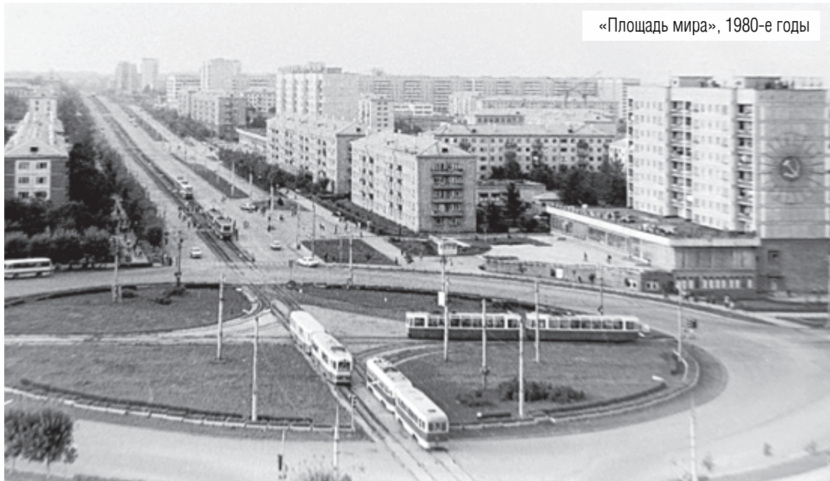
«Площадь мира», 1980-е годы