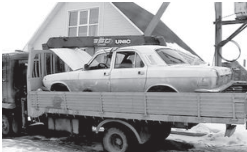
Обработал ДАНИЛ ПРЯЖЕННИКОВ

Двадцатого марта утром в дежурную часть ГИБДД Магнитогорска поступило сообщение из приёмного покоя детской больницы № 3: сюда поступила тринадцатилетняя девочка, пострадавшая в дорожной аварии. Её экстренно отправили на операционный стол.