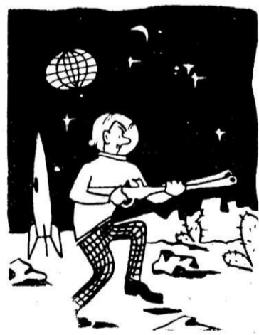
«Говорят, на Венере куропатки вкуснее».