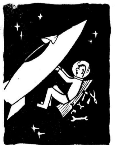
Текущий ремонт. Рисунок А. Шибанова.