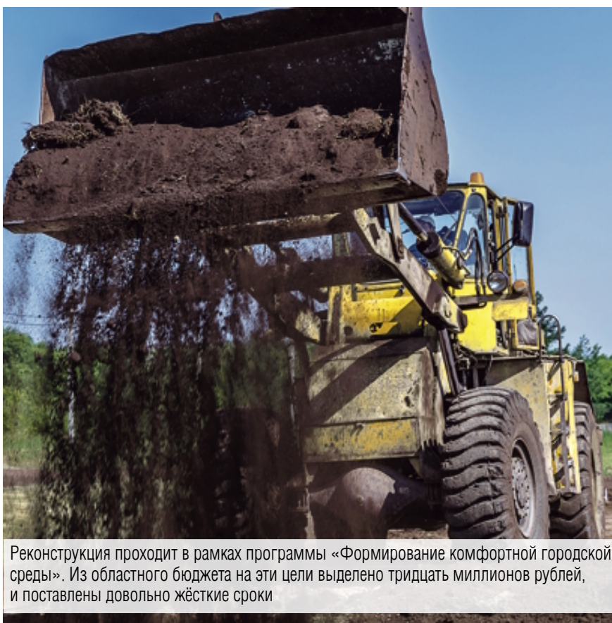
Реконструкция проходит в рамках программы «Формирование комфортной городской среды». Из областного бюджета на эти цели выделено тридцать миллионов рублей, и поставлены довольно жёсткие сроки

В Экологическом парке продолжается масштабная реконструкция