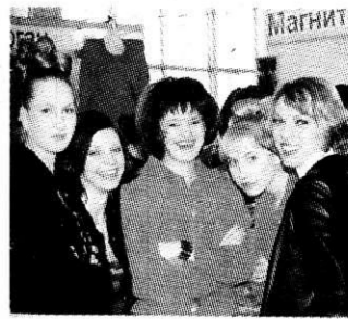
Полку студенток Магнитки прибыло