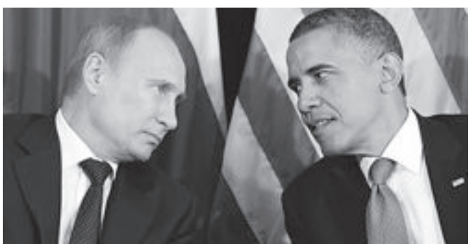
Президенты России и США по телефону продолжили обмен мнениями в связи с кризисом на Украине.

Владимир Путин привлек внимание Барака Обамы к «продолжающемуся разгулу экстремистов, безнаказанно совершающих акты устрашения в отношении мирных жителей, властных структур, органов правопорядка в различных регионах и в Киеве», сообщили в Кремле. Российский лидер предложил рассмотреть возможные шаги международного сообщества по содей-