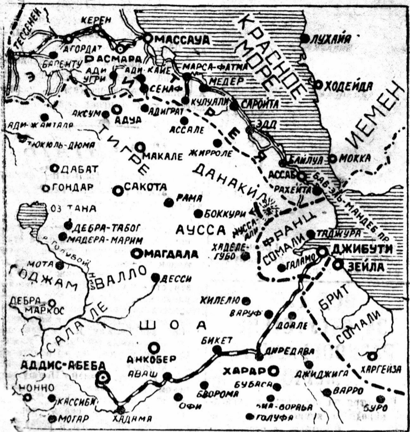
Карта областей Абиссинии, граничащих с итальянской колонией Эритреей.