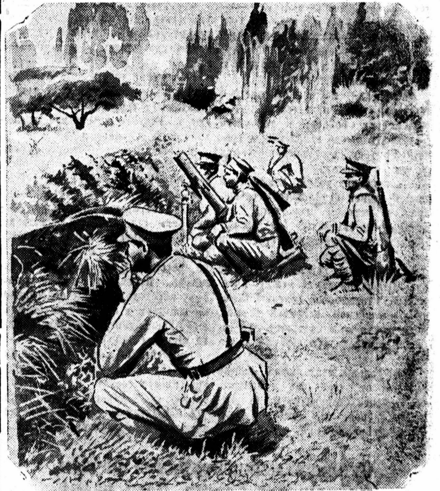
Учебная стрельба мортирной дивизии в абиссинской армии