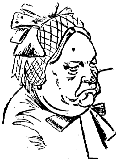
Купчиха Пузатова из пьесы «Бешеные деньги»

А. Цейтлин «Островский» — статья в «Литературной энциклопедии» том 8, стр. 348—372.