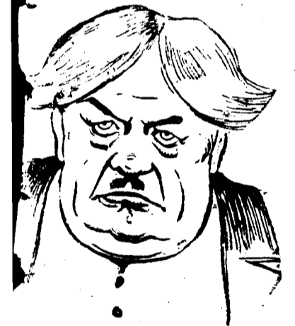
Купец Тит Титыч Большой из пьесы «Бешеные деньги»

«...потребительные общества и советы учредят такой надзор, что всякий Тит Титыч будет дружен, как француз под Седаном» (т. XXI, стр. 126).