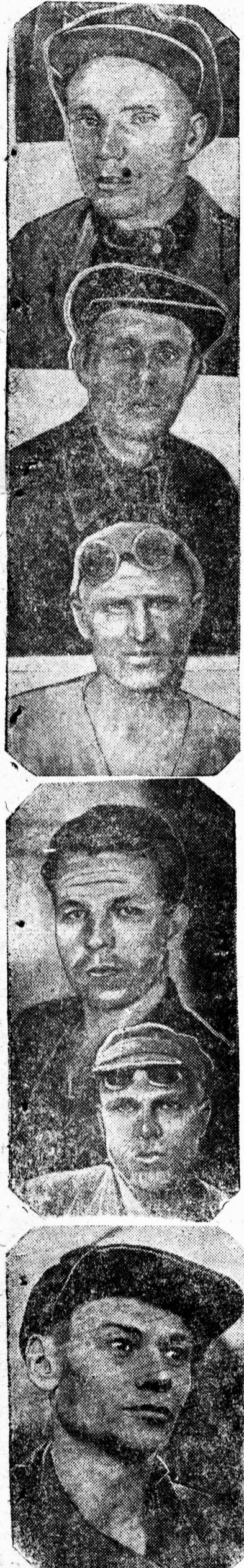
С В Е Р Х У В Н И З: