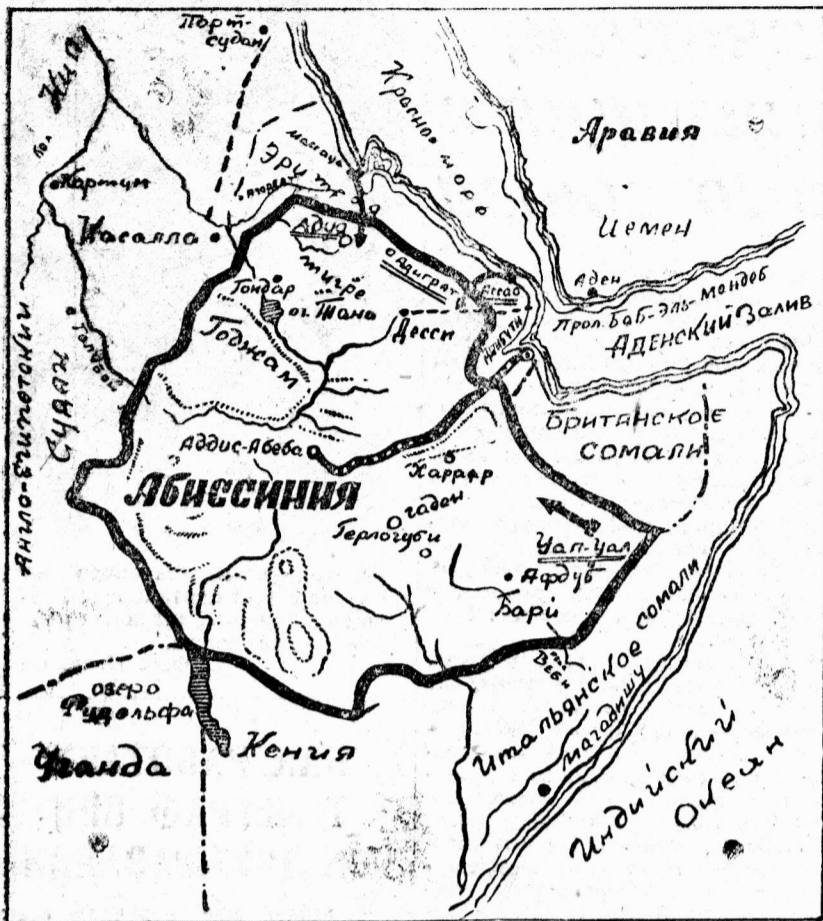
Стрелкой указан путь наступления итальянских армий на южном фронте