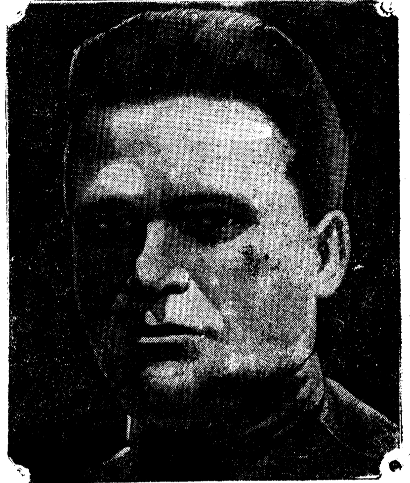
С. М. КИРОВ

Но мы ни на секунду не имеем права ослаблять свою бдительность. Мы обязаны воспитывать тысячи масс в духе непримиримости к врагам, активос и в социалистическом строительстве. Нам необходимо, как говорил любимый Мироныч, — и впредь облюбовать в наших рядах, рядах нашей коммунистической партии, величайшую, глубочайшую партийную бдительность и железную большевистскую дисциплину».