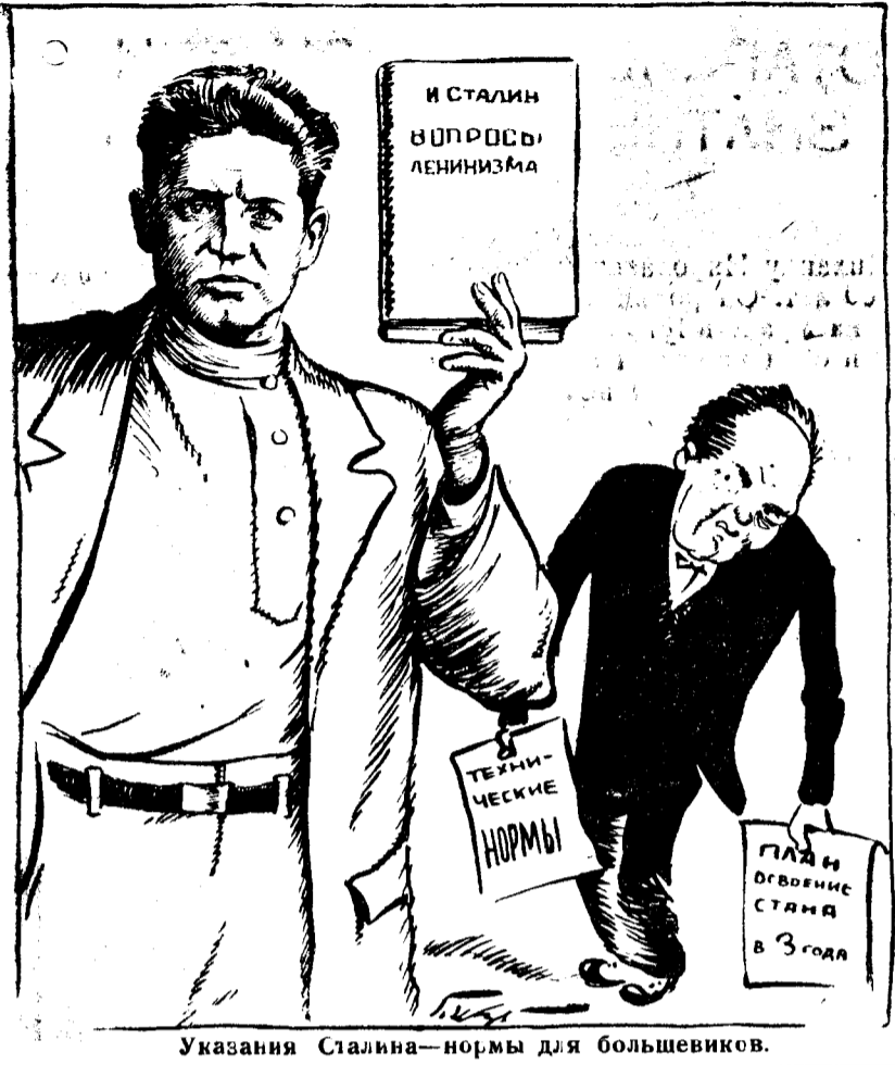
Указания Сталина—нормы для большевиков.