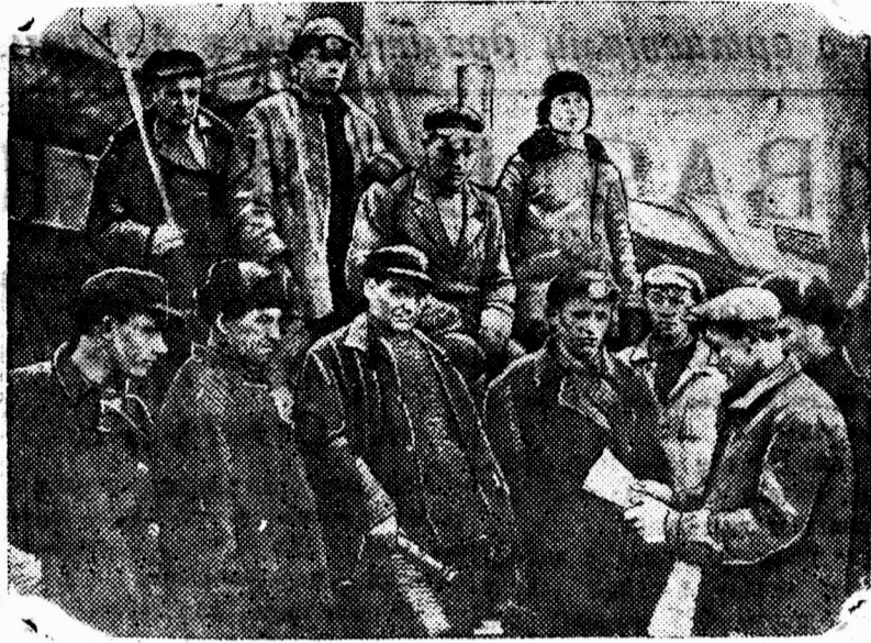
Траурный митинг, посвященный памяти С. М. Кирова, в мартеновском цехе.

Стоя выслушивается и принимается текст приветствия, заключительные слова которого тонут в новой буре оваций и мощных звуках «Интернационала».