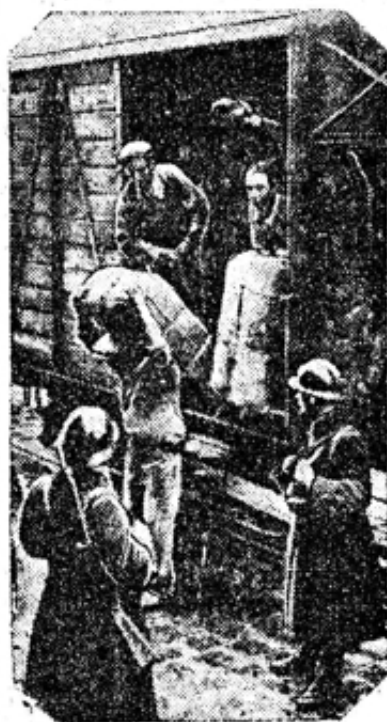
СТАЧКА МАРСЕЛЬСКИХ ДОКЕРОВ. Забастовка 7 тысяч докеров и шоферов грузонных автомобилей Марсельского порта (Франция) закончилась победой рабочих. НА СНИМКЕ: под охраной полиции штурм крехры выгружают в марсельском порту жд состав