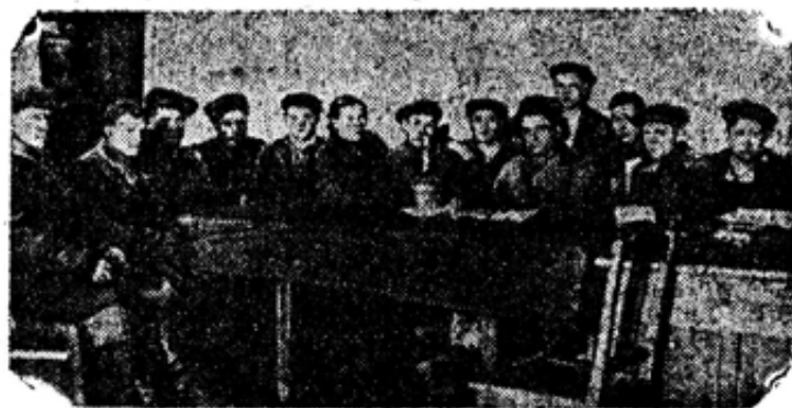
Группа стахановцев с комсомольской домы № 3 на совещании в редакции.