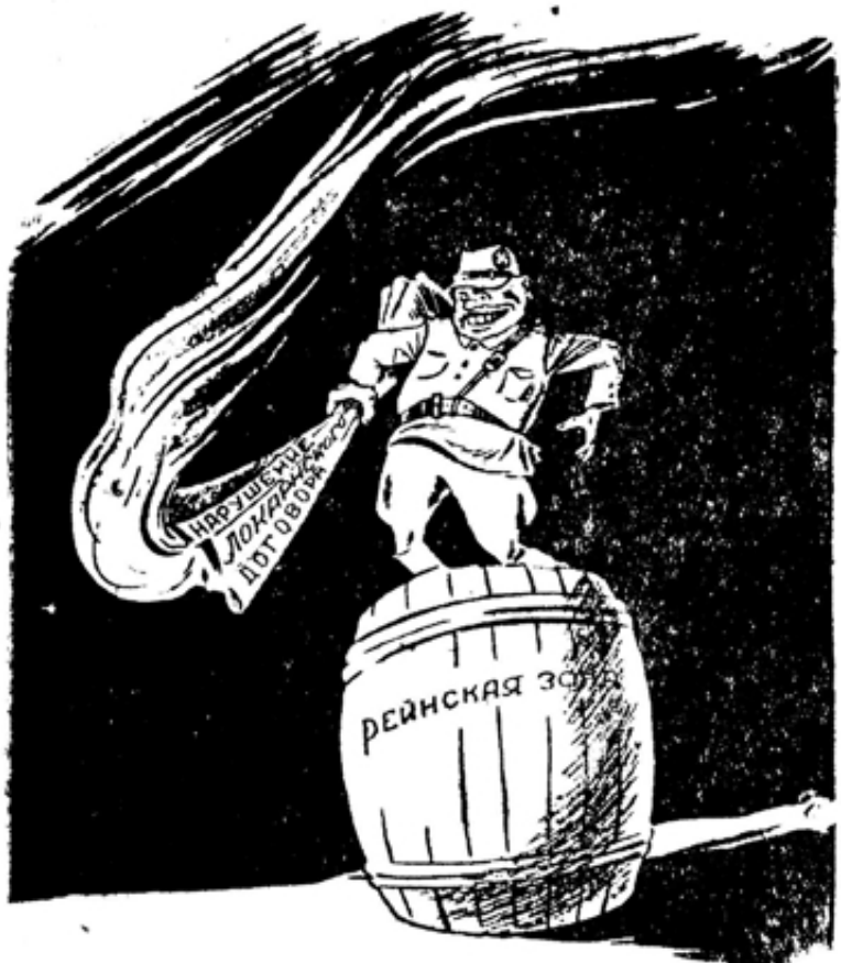
Игра с огнем на пороховой бочке