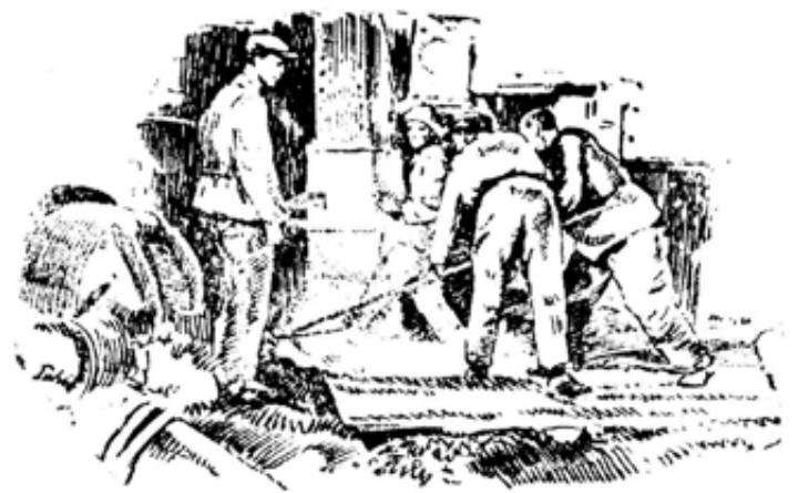
На второй дочинной пачи. Выпуск чугуна.

Вспыхнувшая под влиянием социалистической революции в СССР и успеха Красной армии в Сибири революция 1911 года в Монголии подняла широкие народные массы на борьбу против захвативших Монголию русских белогвардейцев. Партизанские отряды монгольских арат и созданная затем монгольская народная армия в результате жесточайшей борьбы окончательно разбили и изгнали из своей с разнородных захватчиков. На основании от японских войск территории Внешней Монголии в 1921 году образовалось самостоятельное государство. В 1924 году Монголия была объявлена народной республикой. (Продолжение следует).