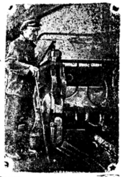
Стахановид, выполняющий работу „3.М“ Крилич.

Технический инспектор ЦБ металлургов Бродский.