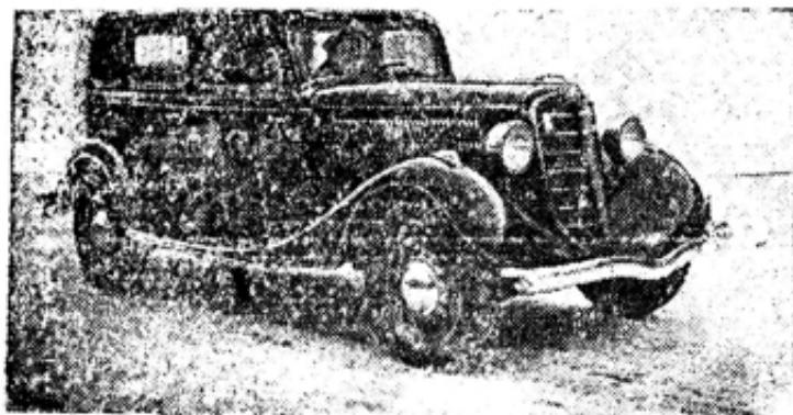
С нового конвейера сборочного цеха Горьковского автозавода им. Молотова 16 марта сошла первая опытная легковая машина «М-1». НА СНИМКЕ:—новая легковая машина «М-1».