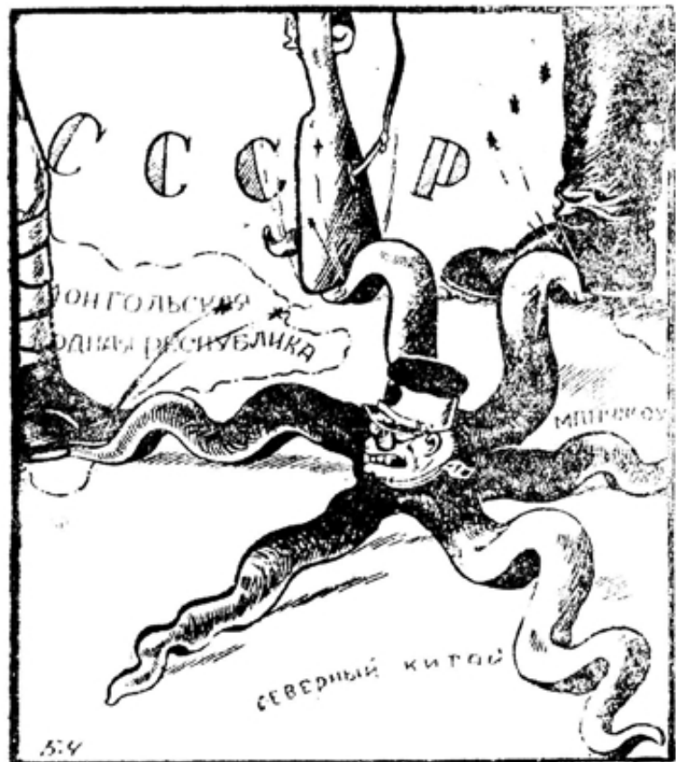
Прочь, от наших границ!