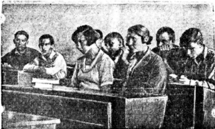
На занятиях в 10 классе 12-й школы