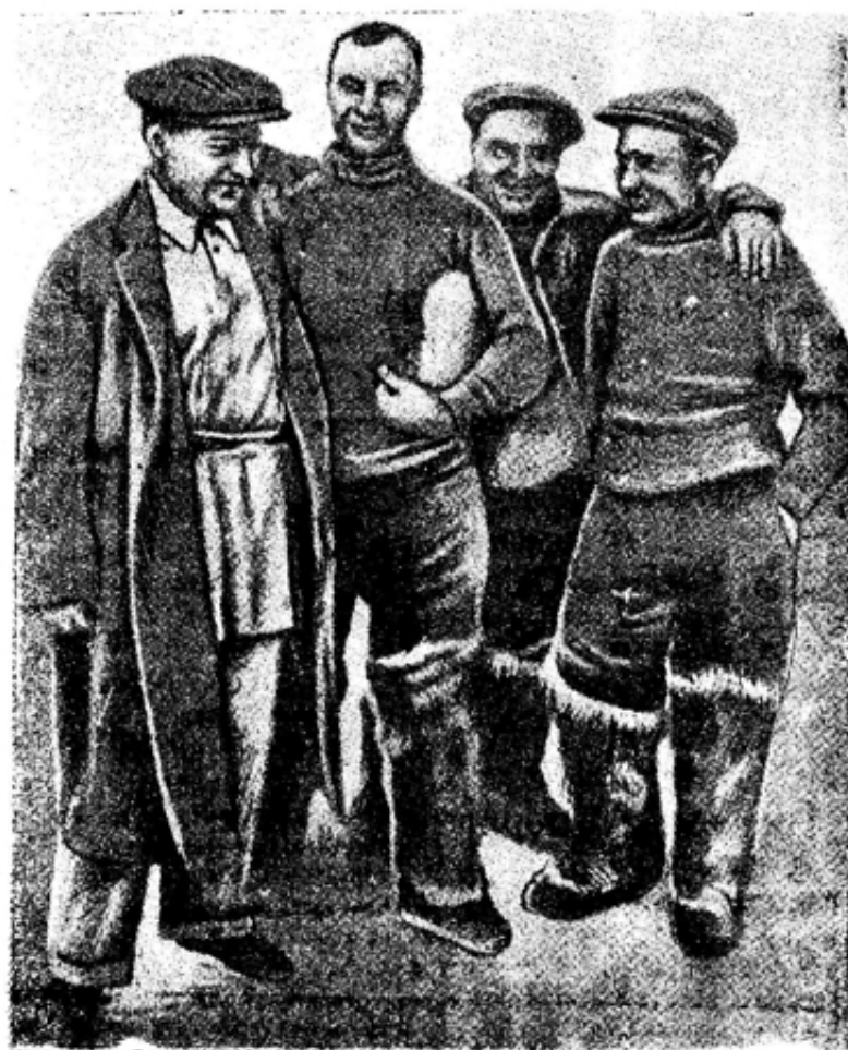
За несколько минут до старта, слева направо: профессор А. Н. Туполев, А. Беляков, В. Чкалов и Г. Байдуков.