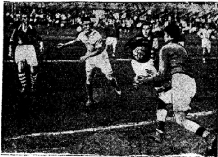
24 июля на стадионе состоялся товарищеский матч между командами сборной города Уфы и сборной металлургов Магнитогорска. Игра закончилась со счетом 3:0 в пользу металлургов. На фото: опасный момент в ворот Уфы.

ДВОРОВ, АЙТУГАНОВ. Рабочие паросилового цеха.