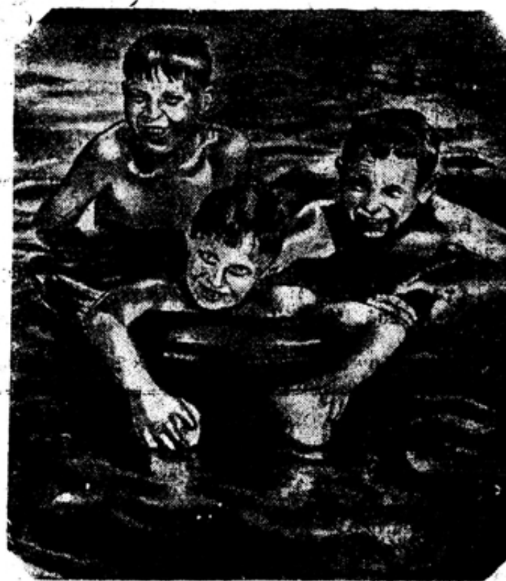
Весело проводит свои каникулы счастливая советская детвора. Рис. Н. Макарова.

Заведующий правовой группой ООТ завода НЕФЕДОВ.