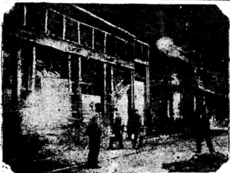
Подмазка столбиков на 3 мартеновской печи.