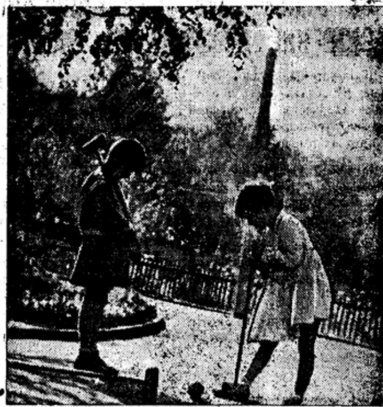
ИГРА В КРОКЕТ.

В связи с тем, что упомянутые в означенном сообщении норвежского правительства меры не могут считаться действительным лишением права убежища, т. Якубович заявил норвежскому министерству иностранных дел, что он довел до сведения советского правительства заявление норвежского правительства, сделанное ему министром юстиции Ли и что советское правительство, к сожалению, не находит возможным признать заявление удовлетворительным и отвечающим дружеским отношениям, существующим между СССР и Норвегией и что по мнению советского правительства своим ответом норвежское правительство взяло на себя всю ответственность за эффективность принятых им мер и за последствия дальнейшего пребывания Троцкого в Норвегии. (ТАСС).