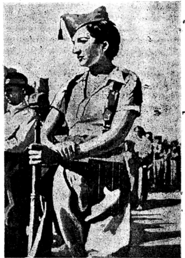
В отряде народной милиции, охраняющей Мадрид