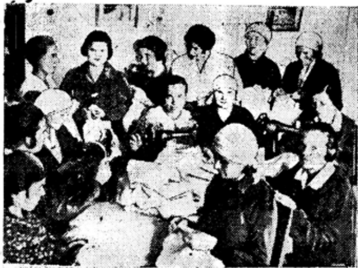
Депутатская группа Кировского района производит пошивку белья для родильного отделения центральной больницы.