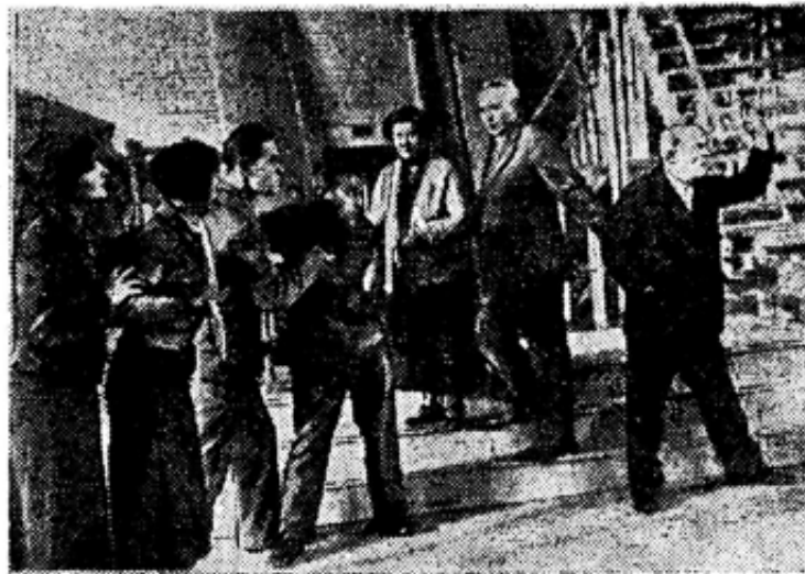
Драматический театр готовит к постановке комедию Шкваркина «Чужой ребенок» под руководством режиссера А. П. Розанцева. На фото: рабочий момент репетиции, 3-й акт, 5-я картина.

Мы приложили все силы, чтобы преподнести нашему зрителю радостный, хороший спектакль. Ждем от рабочих, работников, инженерно-технических работников и служащих завода хорошего посещения театра и сердечного приема нашей постановки.