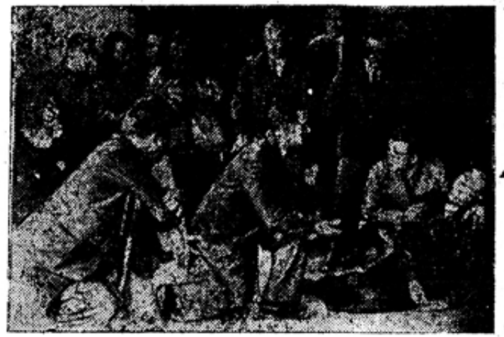
Магнитогорский трам в сезоне 1936—1937 года покажет магнитогорскому зрителю несколько новых пьес. На фото: репетиция 9-й картины пьесы „Коварство и любовь“

Оранжереи открыты с 8 час. утра до 9 час. вечера.