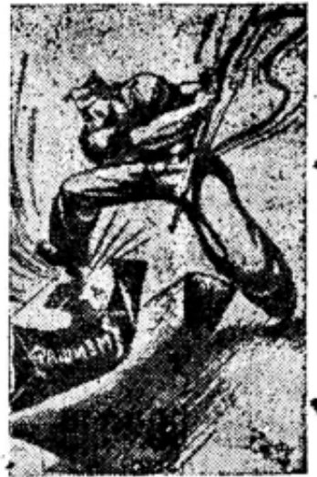
Рисунок из коммунистической газеты Мадрида „Мундо обреро“

Генеральный консул СССР тов. Антонов-Овсенко 2 октября прибыл в Барселону (Испания). 3 октября тов. Антонов-Овсенко посетил главу правительства Каталонии (автономная область Испании) Компаниса. Тов. Антонов-Овсенко и Компанис обменялись речами.