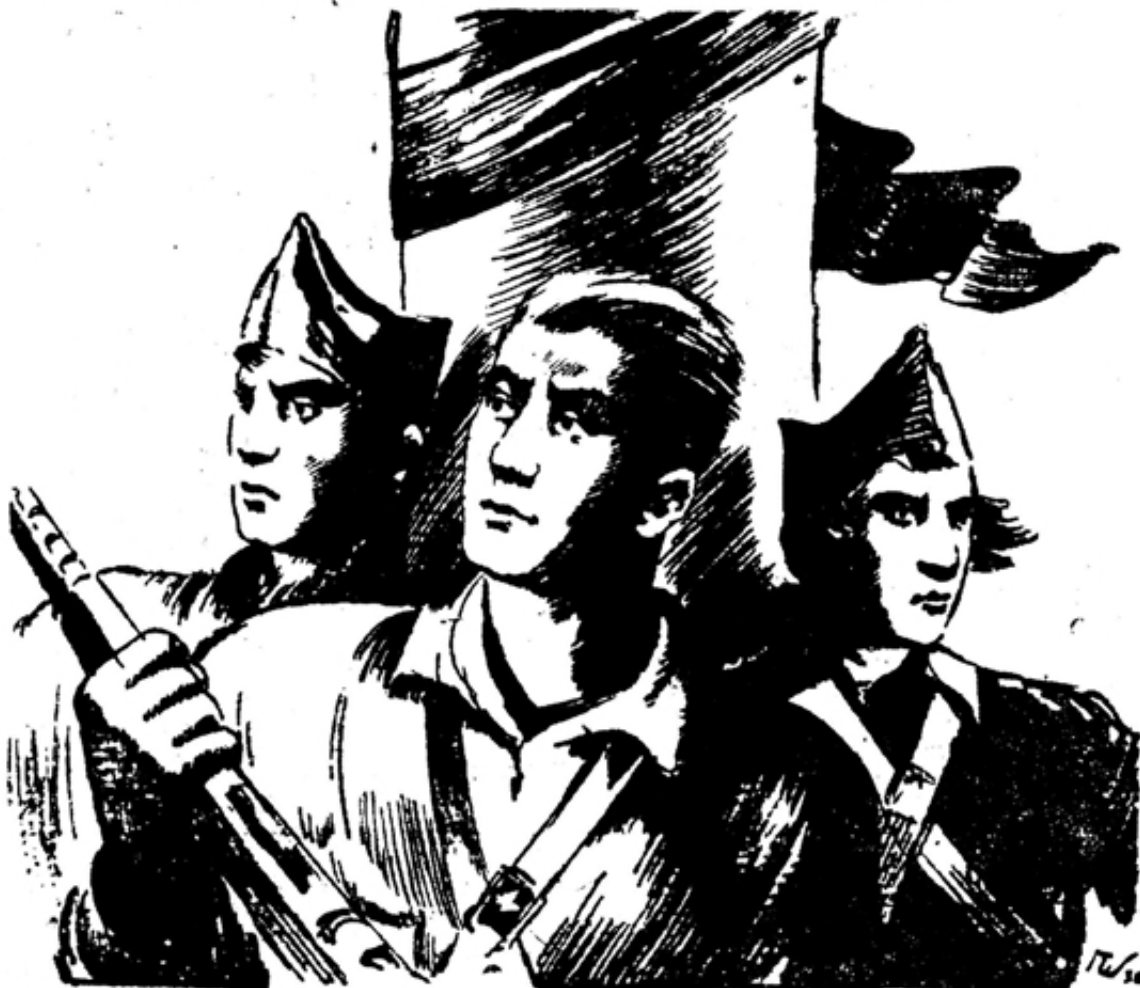
На защиту революционного Мадрида!

Народам Союза ССР, пережившим гражданскую войну и интервенцию почти всех капиталистических государств, полетившая и очень близка к сердцу героическая борьба мужественного испанского народа. Затянувшаяся борьба уже принесла величайшие страдания испанскому народу и потребует еще много сил и жертв от трудящихся. Наступили решительные дни, победа недалека! И в этот момент помощь, казываемая трудящимися странами Советов, наша братская солидарность еще больше вдохновит испанских братьев и сестер на борьбу с фашистскими мятежниками и ускорит победу над врагами народа.