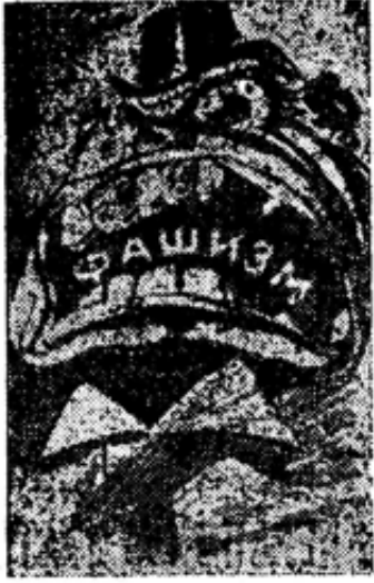
Рисунок из коммунистической газеты Мадрида „Мундо обреро“