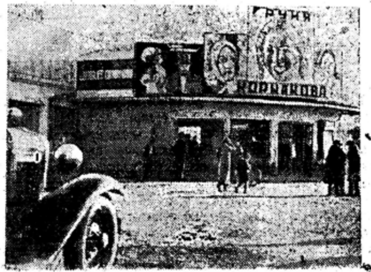
У звукового кинотеатра «Магнит».