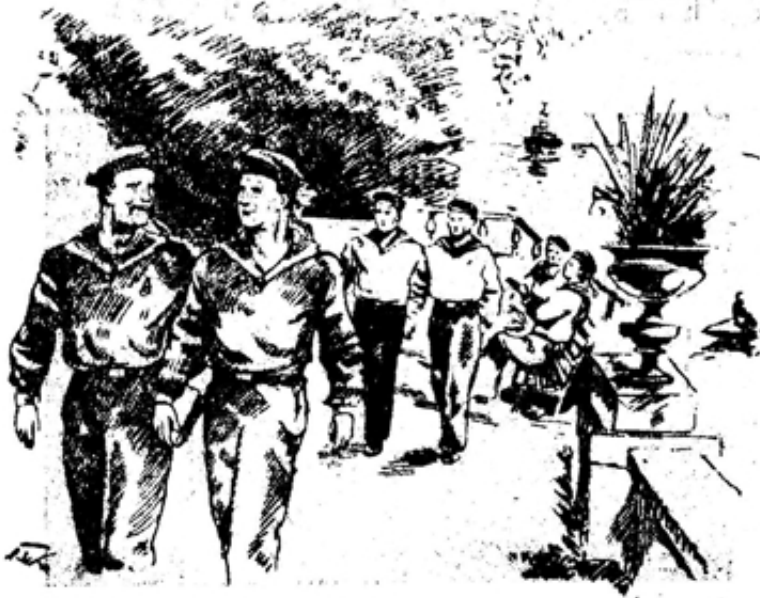
Матросы на отдыхе.