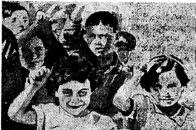
Дети бойцов народной милиции.

Да здравствует наш мудрый вождь и учитель, наш родной товарищ Сталин!