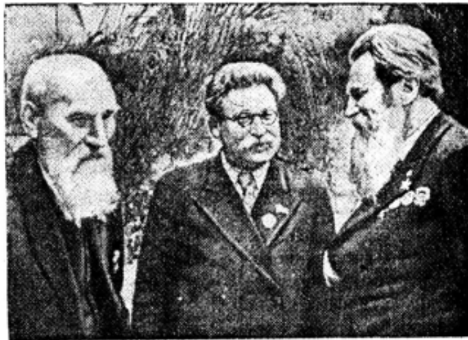
НА СНИМКЕ: Академики А. Н. Бах, Е. Ярославский и О. Ю. Шмидт

В Доме ученых (Москва) состоялось торжественное общее собрание Академии наук СССР, посвященное развитию Марксистско-Ленинской теории в работах И. В. Сталина.