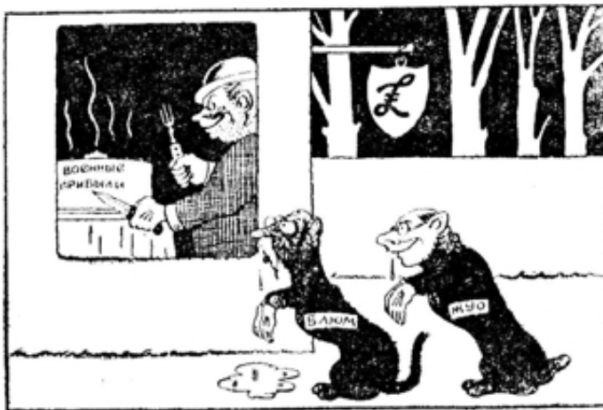
Рис. М. Отарова.

▼ Из Чунцина сообщают, что японские власти ежедневно отправляют на принудительные работы 3 тысячи китайских рабочих из Тяньцзиня в Манчжурию. (ТАСС).