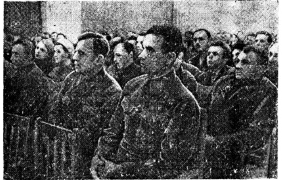
На партактиве Сталинского района.

Заводской комитет ВКП(б). Завком металлургов. Дирекция комбината.