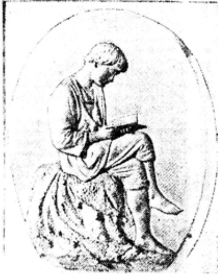
К 175-летию годовщины со дня смерти М. В. Ломоносова (родился в 1711 г., умер 15 апреля 1765 г.). На снимке: барельеф на памятнике М. В. Ломоносову в Ленинграде.