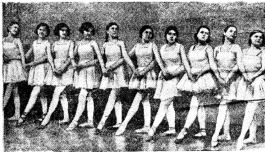
Балетная студия центрального клуба металлургов готовится к выступлению.