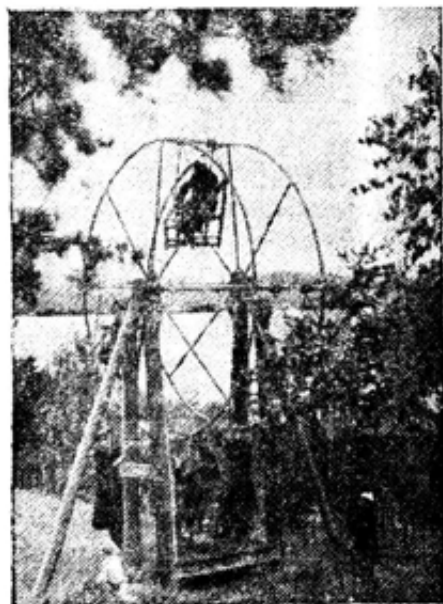
На снимке: вертикальная карусель на Банном озере.

Основное внимание детей было приковано к детской железной дороге и карусели.