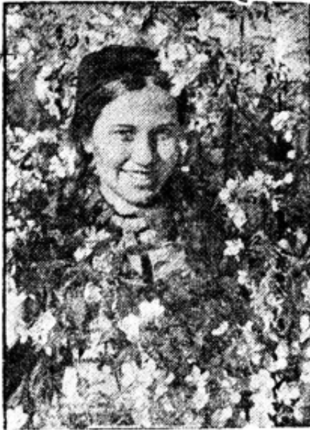
У шестушних аблонь в Кировском районе г. Магнитогорск.