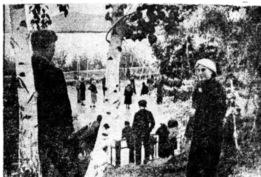
Вид на танцевальную площадку дома отдыха.