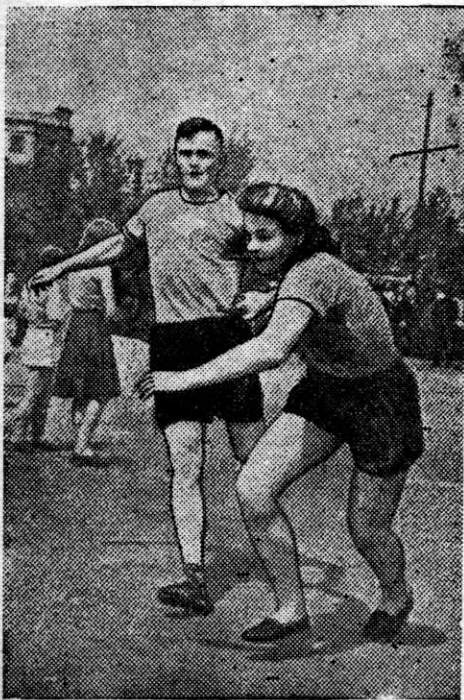
На снимке: момент передачи эстафеты.