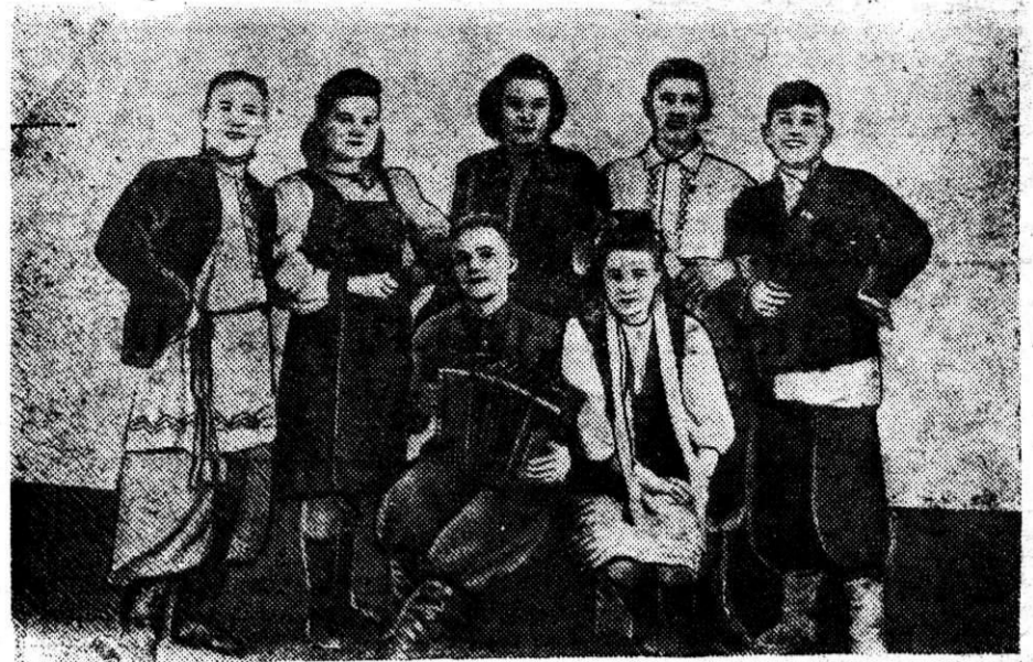
В день выборов активно обслуживал избирателей концертными выступлениями коллектив художественной самодеятельности цеха мартена. На снимке: самодеятельный коллектив на избирательном участке № 52.

Токарь-скоростник коммунист Митель взял обязательство поднять производительность на своем станке на 50 процентов и выполнить нормы второй послевоенной па-