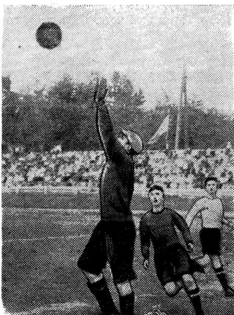
На снимке: момент игры футбольных команд спортобщества «Металлург» Магнитогорска и Челябинска.

Таким образом, футбольная команда нашего комбината одержала новую победу со счетом 3:0.